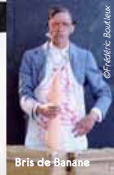
Bris de Banane