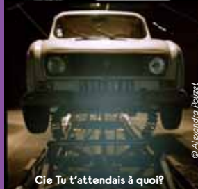
Cie Tu t'attendais à quoi?