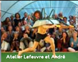
Atelier Lefevre et André