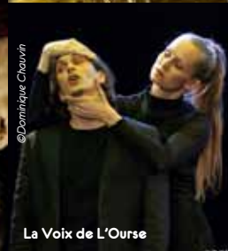
La Voix de L'Ourse