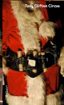
Tony Clifton Circus