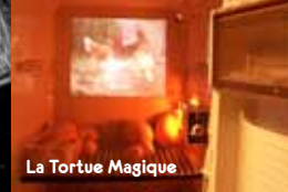
La Tortue Magique